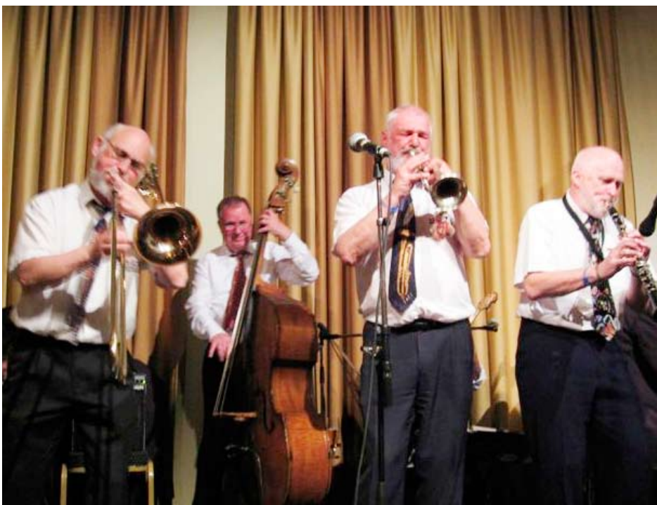
Lime River Jazzband.

"I Håndværksrådet har vi berøring til 65 håndværks- og industriforeninger, og den i Aalborg er noget særligt i kraft af, at den evner at sætte så mange aktiviteter i gang. Den arbejder med fokus på den lokale erhvervspolitik og er bl.a. gennem sin gode dialog med kommunen med til at præge udviklingen til gavn for områdets små og mellemstore virksomheder. Det er flot og aktuelt af en forening, der er startet i protest og undervejs udviklede sig til en ren festforening".