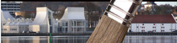
Utzon Center, nybyg