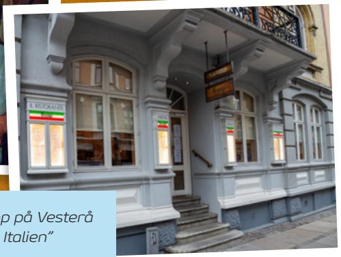
Fem skridt op på Vesterå og man er "i Italien"

dag har det været en fornøjelse at servicere kunderne her i Vesterå.