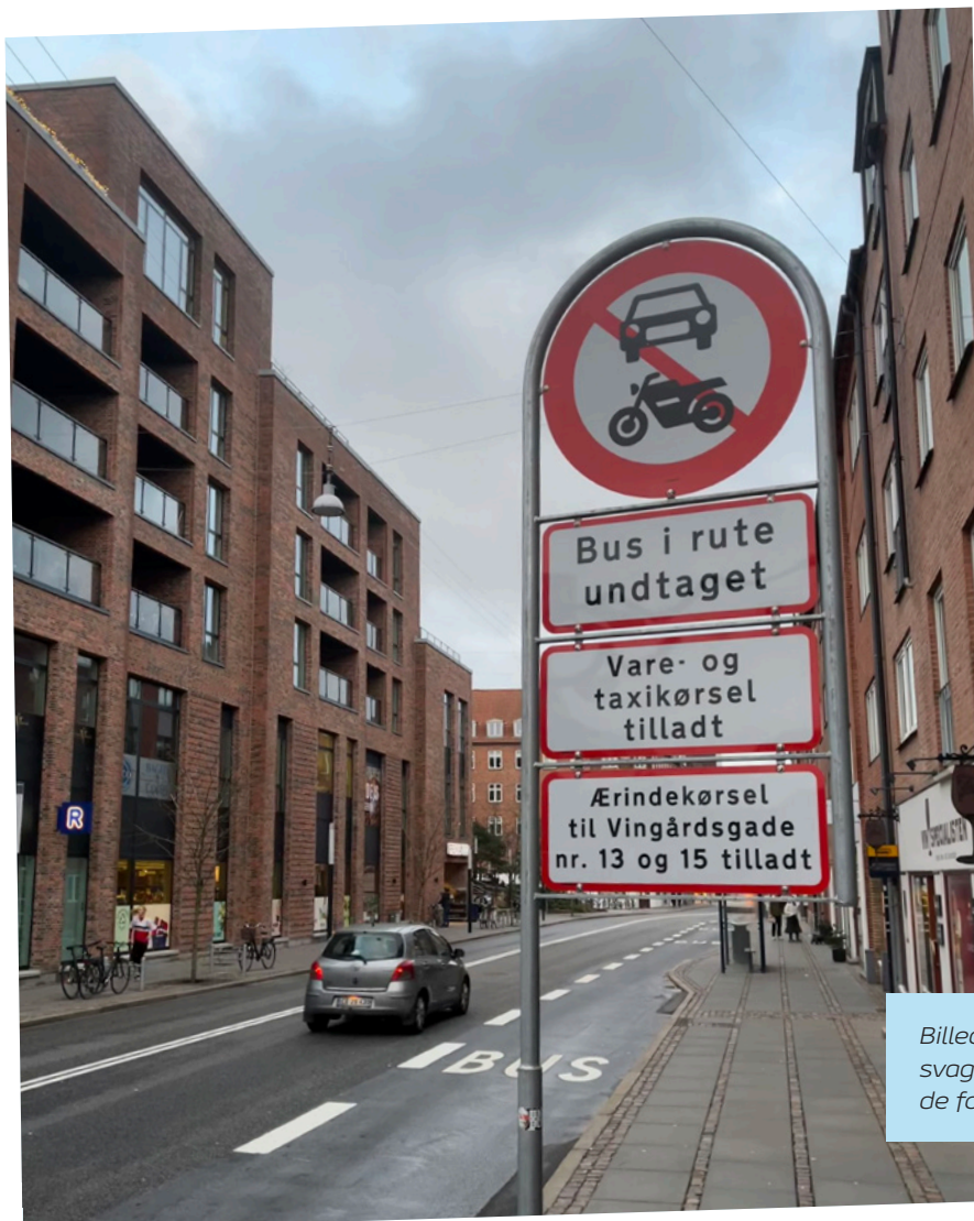
Billedet er taget i Vingårdsgade. Skiltet antyder kun svagt, at bilister 100 meter fremme får en bøde, hvis de fortsætter ligeud.

- Hvis man kun indretter centrum efter gående og cyklister, så dør bykernen som indkøbssted - omsætningen flytter dels til nethandel