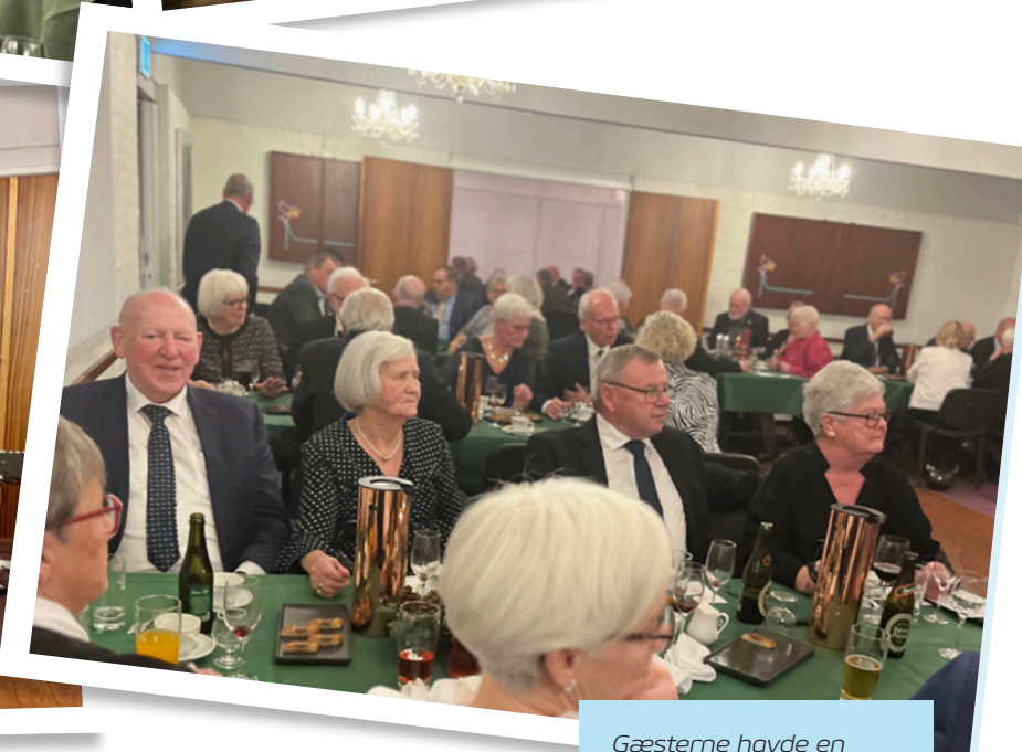
Gæsterne havde en fornøjelig aften