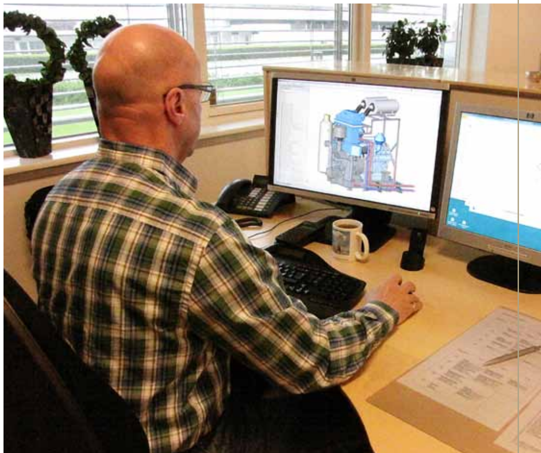
De kundetilpassede højtryksanlæg designs på et avanceret 3D Cad anlæg.

- Travlheden tog fart, efter vi i 2006 byggede den ny fabriksbygning. Det var et vendepunkt. At flytte ind i en bygning, der er indrettet helt efter den måde, vi producerer på, øger båd-