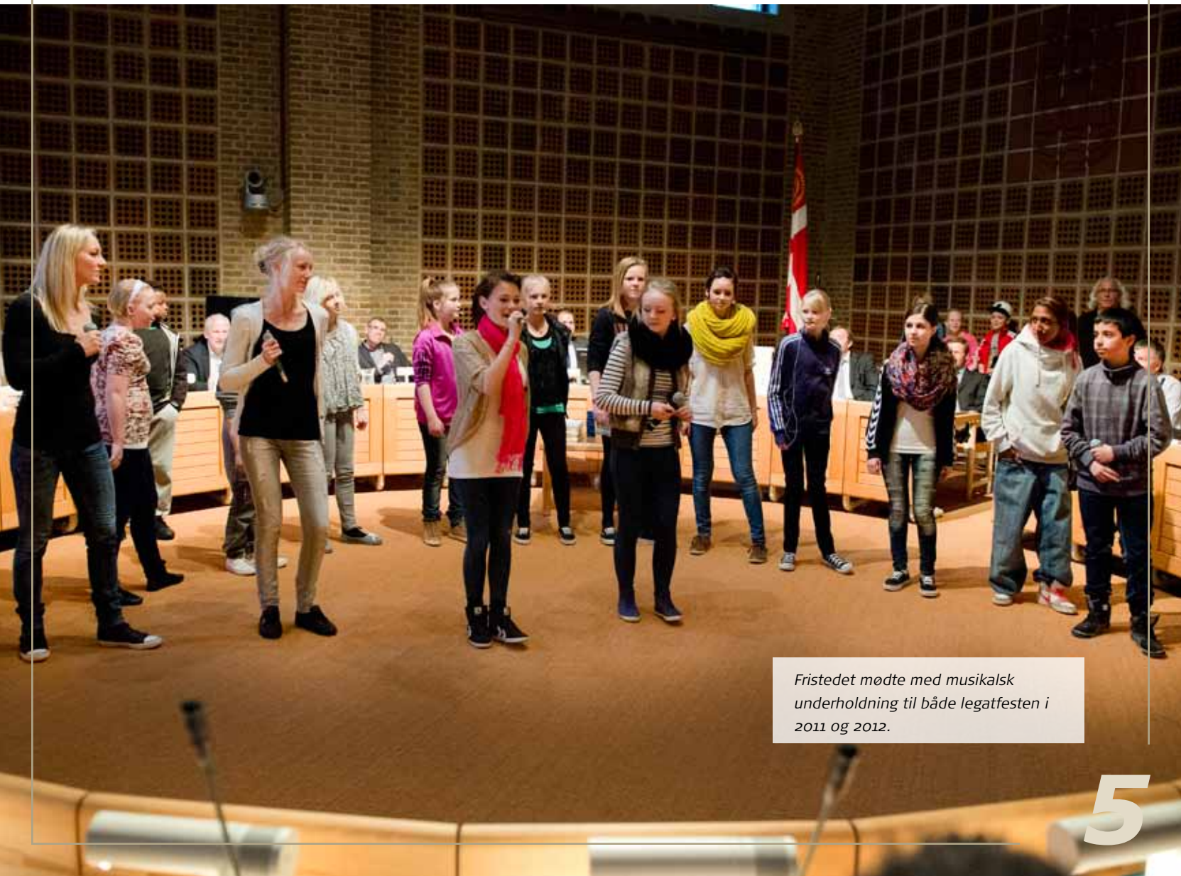
Fristedet mødte med musikalsk underholdning til både legatfesten i 2011 og 2012.

Det er Aalborg Haandværkerforenings klare synspunkt, at den eksisterende erhvervsuddannelsesmodel mangler overensstemmelse med samfundets virkelighed, og at der derfor også i de