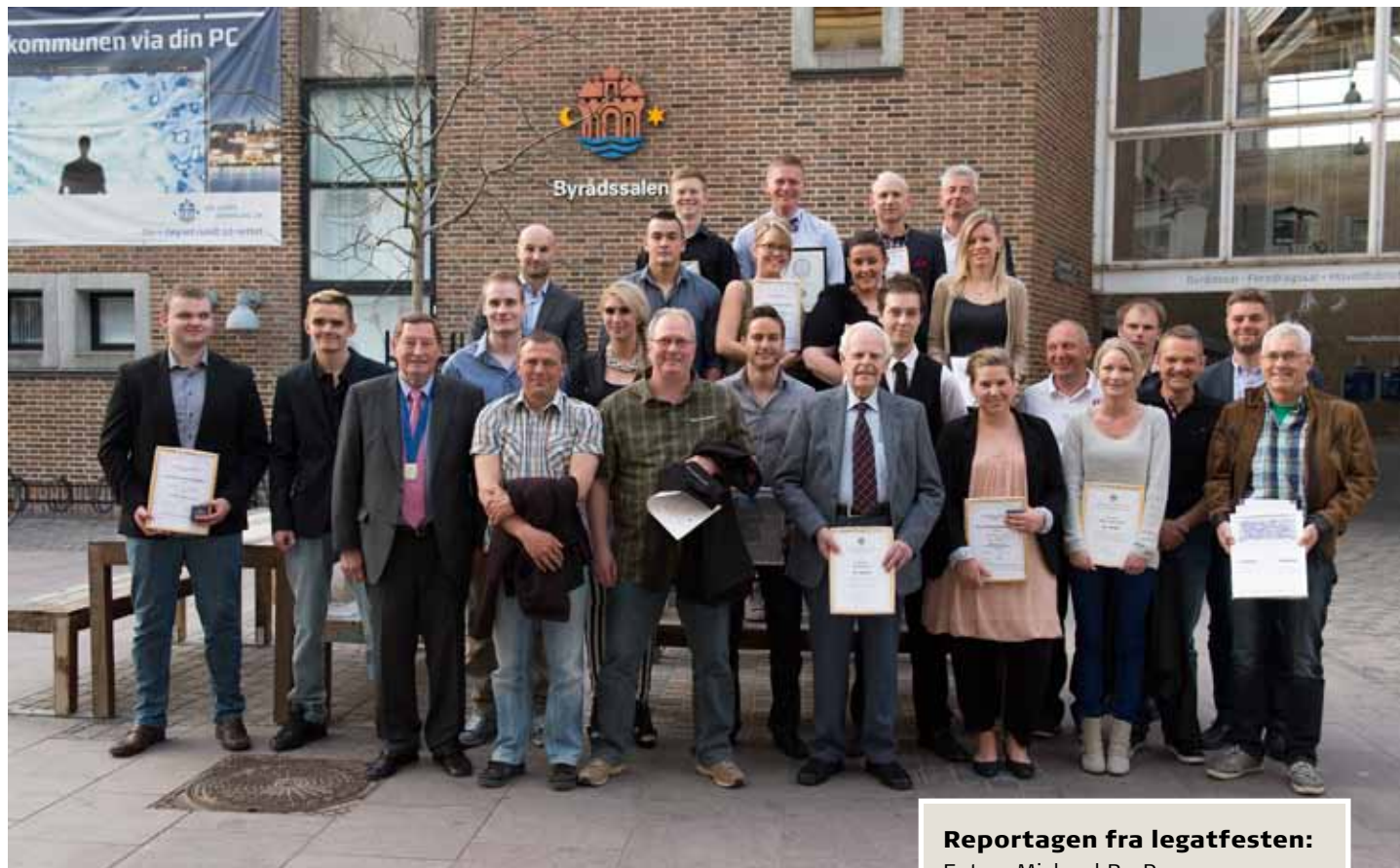
Flokken af legatmodtagere samlet uden for byrådssalen. På billedet øverst er det Sjakket fra Fristedet, der er i manegen

gene til Aalborgs hyldest. Det er lejlighedssange med tryk på og mening bag.