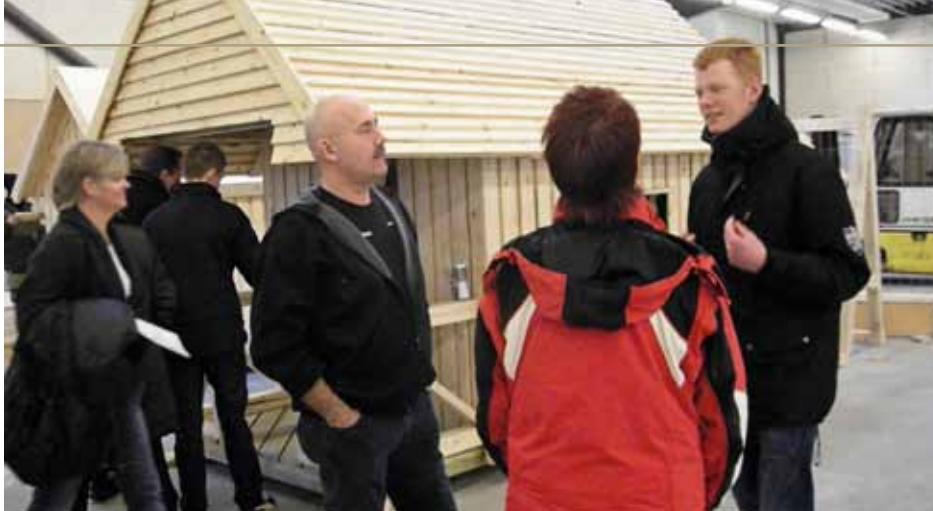
Til åbent hus på Tech College Aalborg var der også i år stor interesse for tømreruddannelsen

Aalborg Haandværkerforening var i 1849 initiativtager til den institution, der blev til Aalborg tekniske skole og