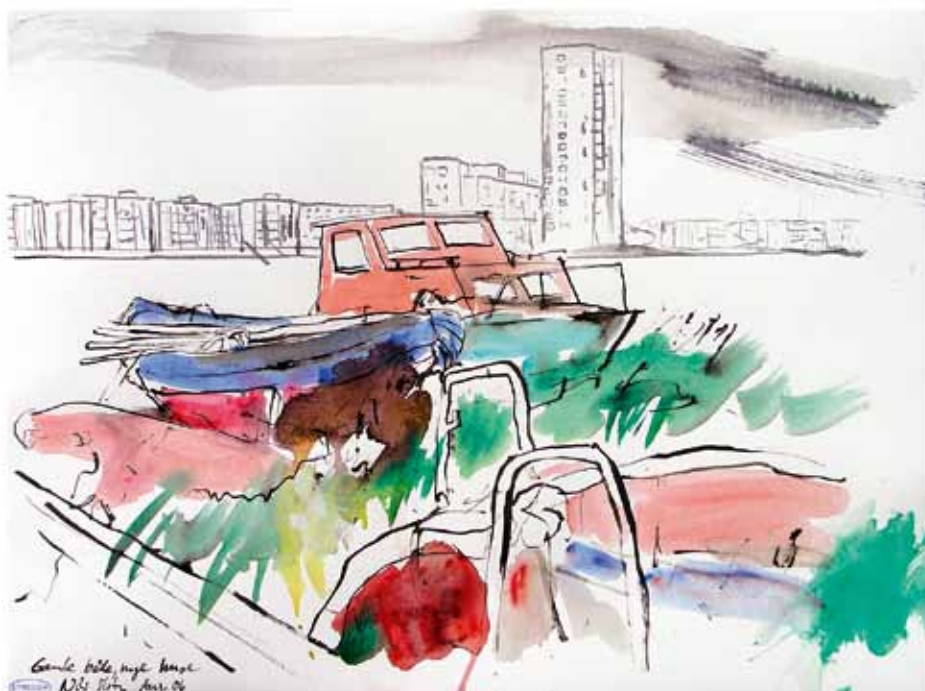
I august 2006 udførte Nils Slot hver dag mindst tre tegninger fra Aalborg. Denne er fra området ved Skudehavnen, "Gamle både, nye huse". (Fra bogen "STREGER")