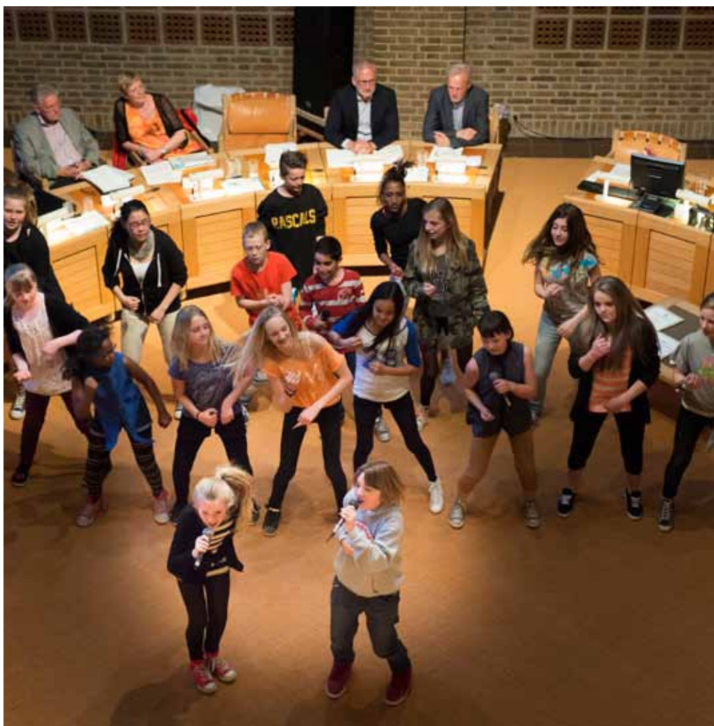
Også til legatfesten 2013 gav de unge fra Fristedet et medrivende show i byrådsalen

Den 18. oktober blev der taget første spadestik til det ny universitetshospital i Aalborg Øst. Det er det hidtil største byggeprojekt i Nordjylland. Byggeperioden er syv år, budgettet 4,1 milliard kroner, og der forventes at være anvendt 3,3 millioner mandetimer, når de 135.000 m 2 indvies i 2020. Region Nordjylland har meldt ud, at udbuddene så vidt muligt vil blive