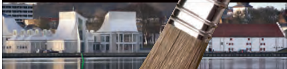
Utzon Center, nybyg