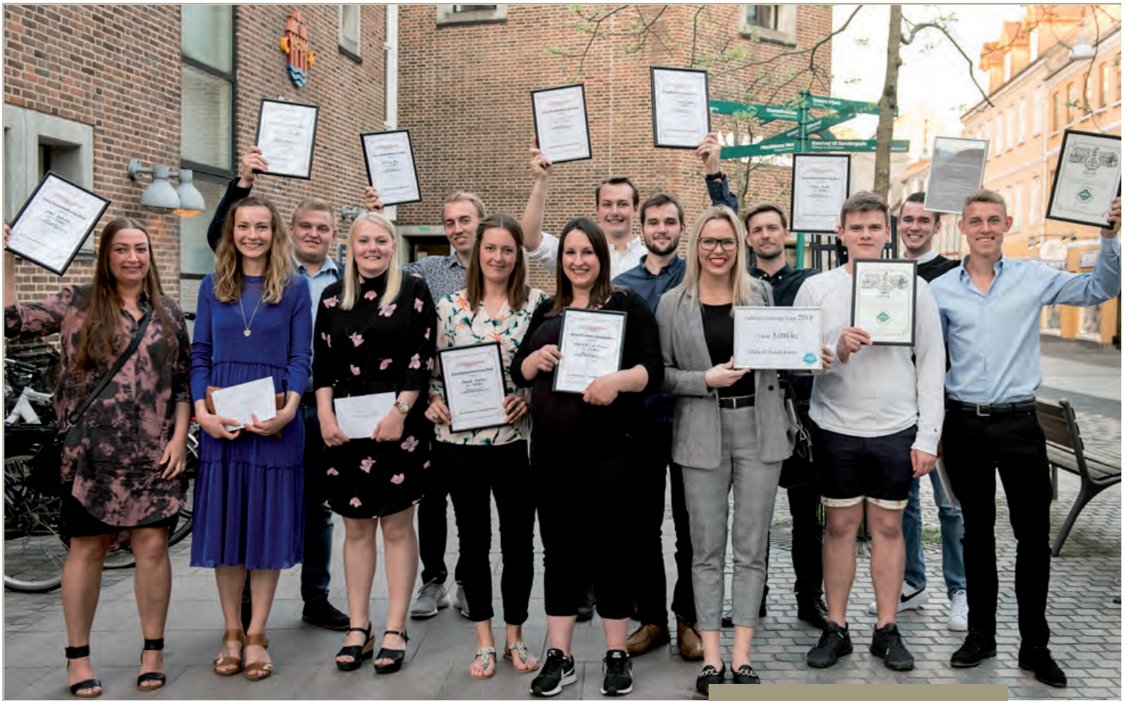
De glade modtagere af legaterne fra Aalborg Haandværkerforening, laugene og mesterforeningerne

VARELOTTERIETS FORHANDLERE FINDES PÅ www.varelotteriet.dk