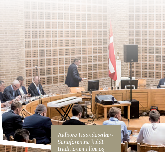
Aalborg Haandværker-Sangforening holdt traditionen i live og bidrog til den gode stemning.