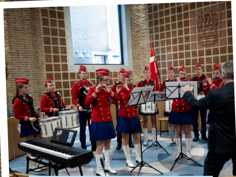
Aalborg Håndværker Sangforening og Aalborg Pige-garden underholdt gæsterne ved Legatfesteren.