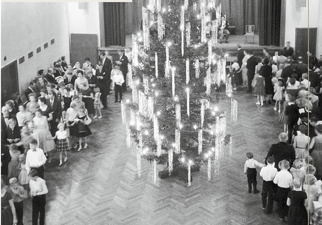
Frem til Aalborghallens indvielse i 1953 var Haandværkerforeningens store sal det største mødelokale i byen. Her holdtes også de berømte juletræsfester

på håndværkernes monopol på fremstilling af selv dagligdags fornødenheder.