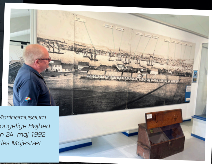
Aalborg Søfarts- og Marinemuseum blev indviet af Hans Kongelige Højhed Prinsgemal Henrik den 24. maj 1992 i overværelse af Hendes Majestæt Dronning Margrethe.