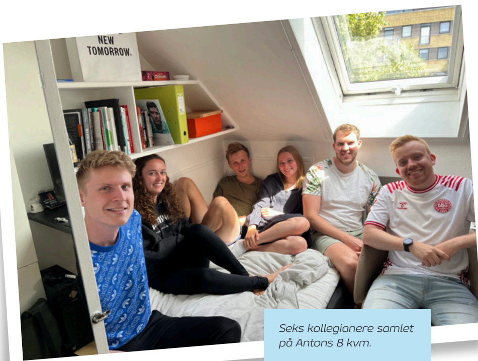
Seks kollegianere samlet på Antons 8 kvm.