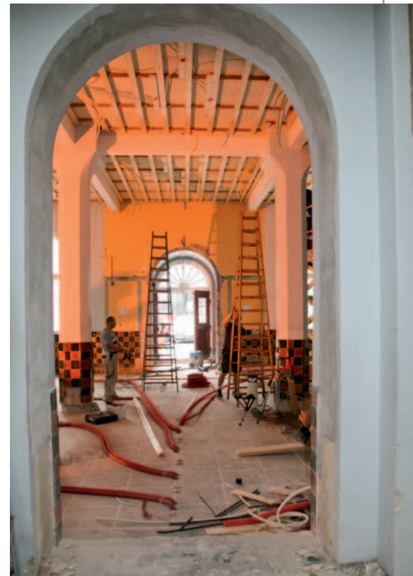
Aalborgs 103-årige posthus er blevet "strippet" indvendigt inden den nye funktion som Sparekassen Vendsyssels nye Aalborg afdeling

Det omfattende projekt er ved en indbudt licitation blandt sparekassens håndværkerkunder udbudt i fagentre-priser.