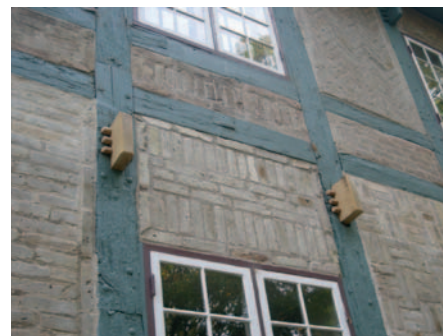
Facaden mod syd er blevet forsynet med nye, dekorative tapender

Inden kommunesammenlægningen i 1970 overgik Svalegaarden til en række lokale organisationer med tilknytning til Hasseris-området – for en sum af 50.000 kr. Bestyrelsen består