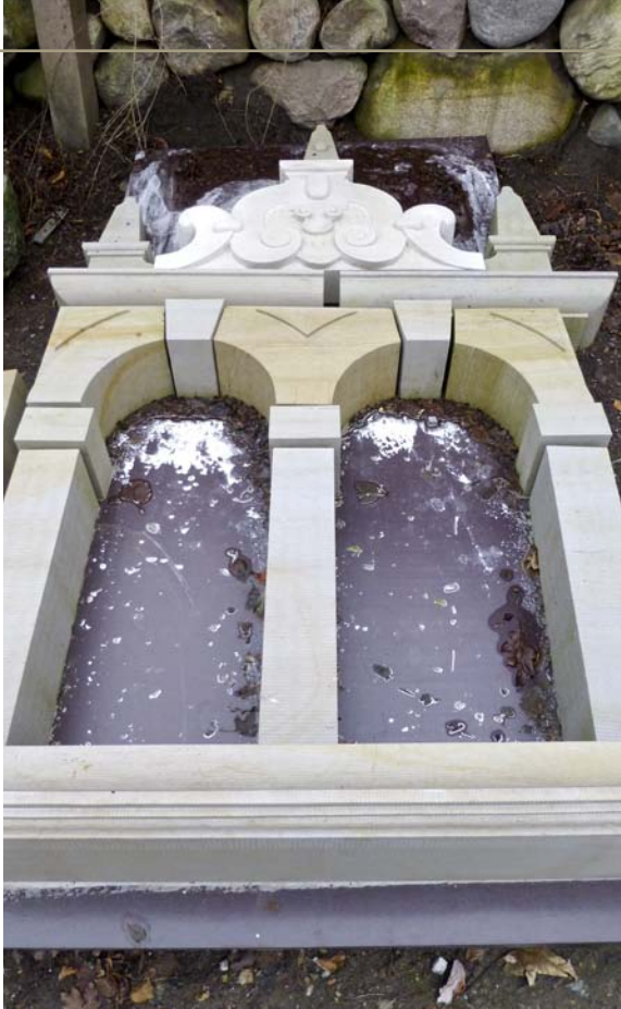
Udskiftningen af sandsten blev indledt i 2012, og stenhuggermester Jan Hemmsen (øverst til højre) er i gang med at udhugge ny sten, der bliver muret ind i 2015