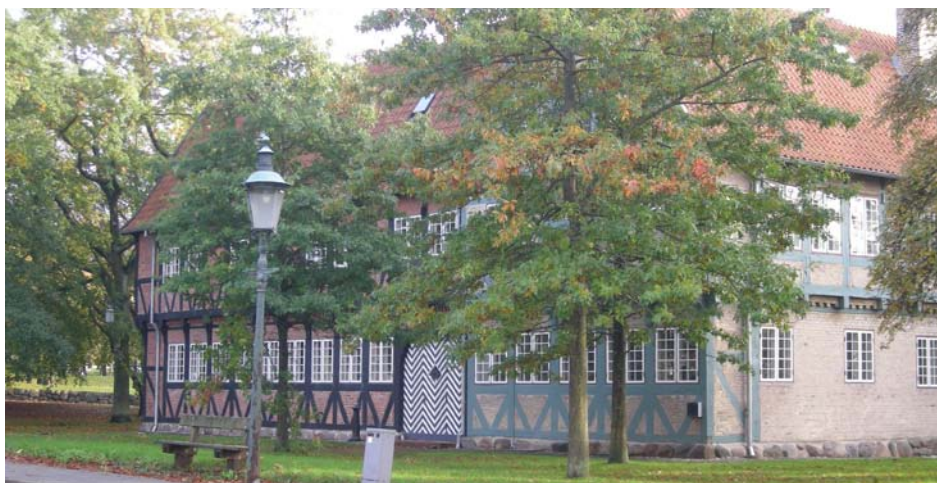
Svalegaarden har 400 års historie og er blevet pietetsfuldt vedligeholdt siden genopførelsen i Hasseriis 1950-52