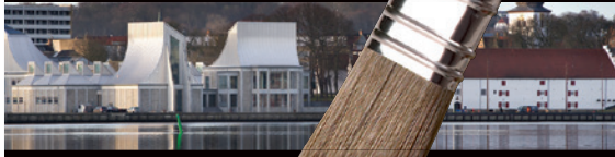
Utzon Center, nybyg